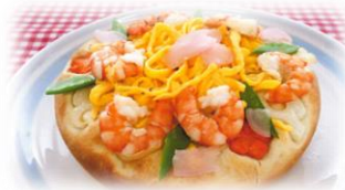
岡山県立興陽高等学校 「うめ!!ばらずしパン」