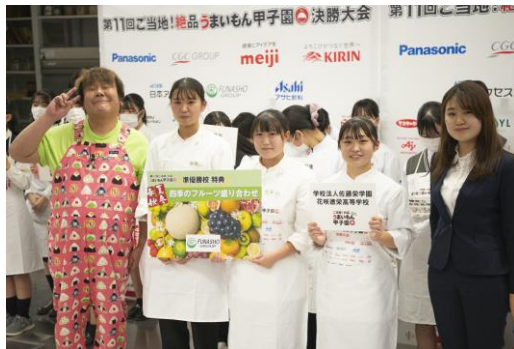
花咲徳栄高等学校 こめつけ