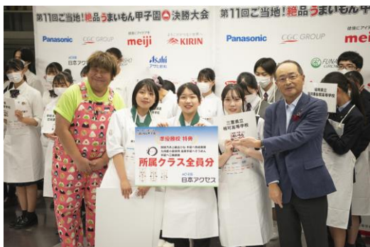
三重県立相可高等学校 BBジビエスティック