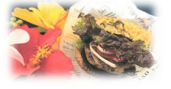
沖縄県立美里工業高等学校 「じゅーしーバーガー」