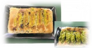
福岡県立八女農業高等学校 「餃茶」