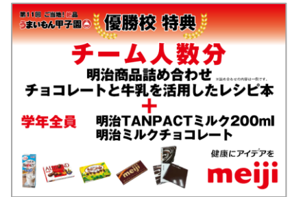
明治商品詰め合わせ チョコレートと牛乳を活用したレシピ本 明示TANPACTミルク200ml チーム分+学年全員分