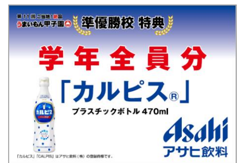
「カルピス」学年全員分