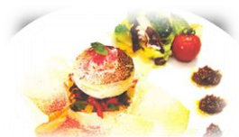
宮城県農業高等学校 「#輪華~心のバトン~」