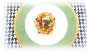
沖縄県立中部農林高等学校 「グルリア」