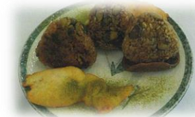
兵庫県立篠山東雲高等学校 「デカンショアルプス」