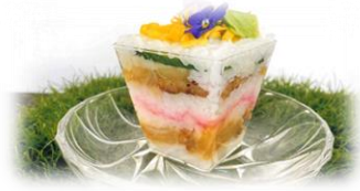
千葉県立流山高等学校 「チバ押し」