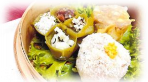
福知山淑徳高等学校 「豆腐と湯葉とお茶焼売」