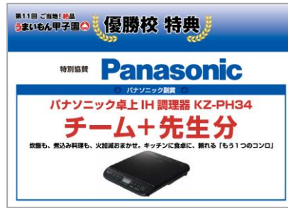
パナソニック卓上IH調理器 チーム+先生分