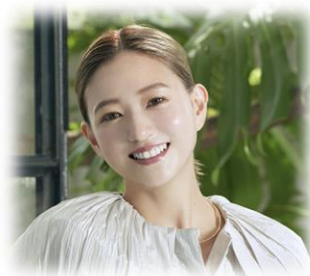
タレント/歌手 伊藤 千晃様