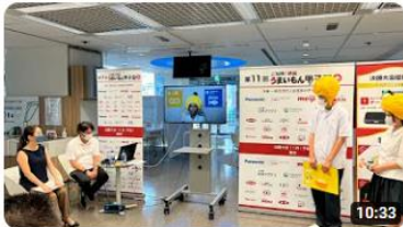
第11回ご当地！絶品うまいもん甲子園中国四国エリア選抜大会 388 回視聴・4 か月前