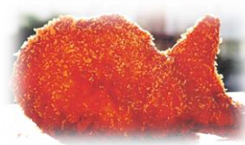
和歌山県立神島高等学校 「うめえ！揚げたい焼き」