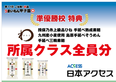
揖保乃糸上級品ひね手延べ熟成素麺 九州産小麦使用 島原手延べそうめん 手延べ三輪素麺 所属クラス全員分