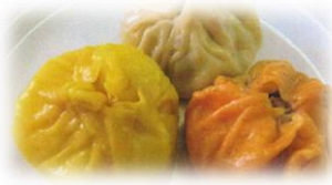
瓊浦高等学校 「長崎ランタンポウ」