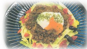
広島県立西条農業高等学校 「衝撃のキーマ!!」