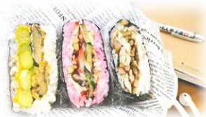
愛知県立半田商業高等学校 「希望の海音貝ぎらず」