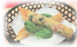
三重県立相可高等学校 「BBジビエスティック」