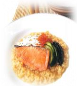
新潟県立海洋高等学校 「バタバタ茶がゆ」