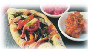
千葉県立館山総合高等学校 「魅惑の猪P (シシップ)」