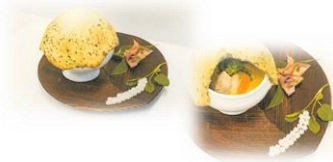
滋賀県立伊吹高等学校 「ま鹿る伊吹山パイ包み」