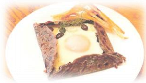
神戸大学附属中等教育学校 「ソッカ・ノワール」