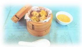
沖縄県立美里工業高等学校 「琉球ショーロンポー」