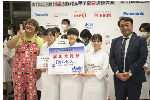
福知山淑徳高等学校 豆腐と湯葉とお茶焼売