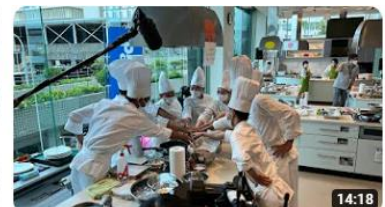
第11回ご当地！絶品うまいもん甲子園沖縄県選抜大会 551 回視聴・3 か月前