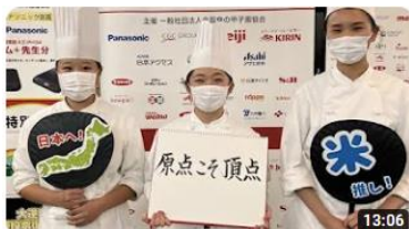
第11回ご当地！絶品うまいもん甲子園関東甲信越エリア選抜大会 700 回視聴・3 か月前