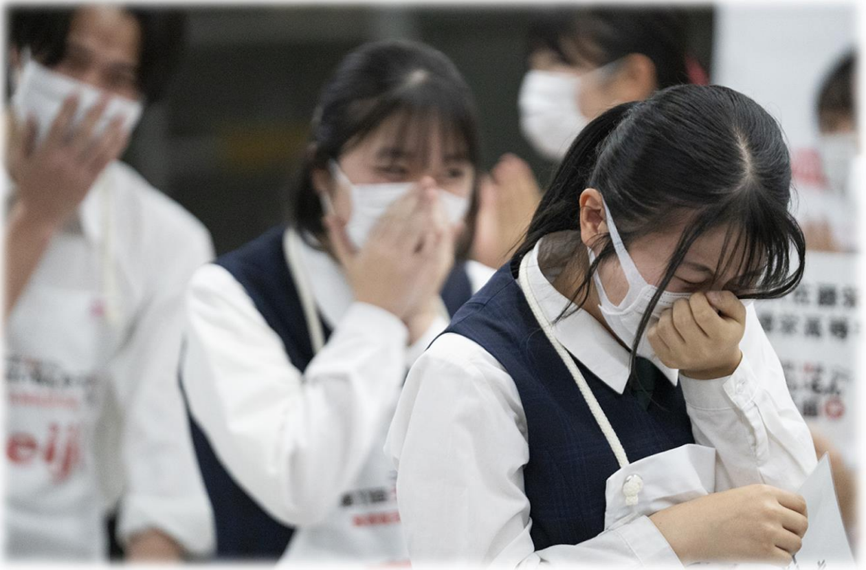
北海道帯広南商業高等学校 / わやうめえ蝦夷にぎ 2