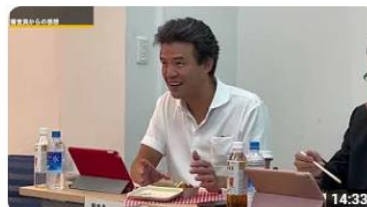
第11回ご当地！絶品うまいもん甲子園九州エリア選抜大会 403 回視聴・3 か月前