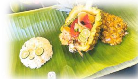
沖縄県立美里工業高等学校 「獅子も驚く！南国漬け」