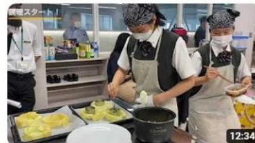
第11回ご当地！絶品うまいもん甲子園北海道東北エリア選抜大会 621 回視聴・3 か月前