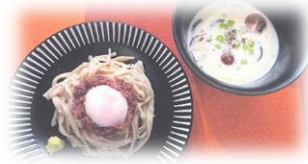
静岡県立田方農業高等学校 「函南イノシカルボ」