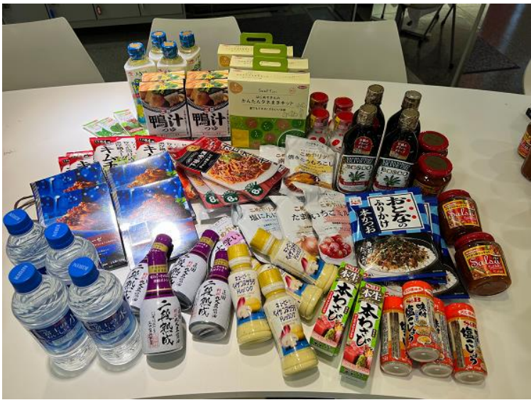
7エリアの選抜大会で掲示