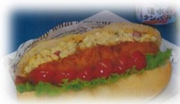
青森県立弘前実業高等学校 岩手県立大船渡東高等学校 「シャク鮫(シャーク) ロマン」 「海の森のケーキサレ」