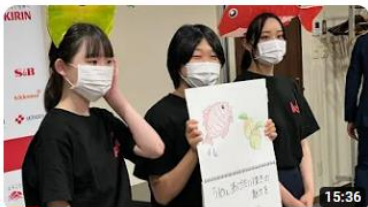
第11回ご当地！絶品うまいもん甲子園近畿エリア選抜大会 648 回視聴・3 か月前