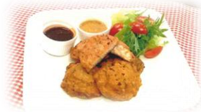
大分県立佐伯豊南高等学校 「大分ぶりナゲっちゃ！」