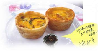
沖縄県立向陽高等学校 「ちむどん58キッシュ」