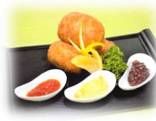
花咲徳栄高等学校 「こめつけ」