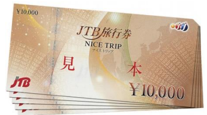
「旅行券10万円」チーム人数分