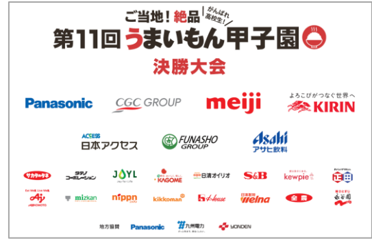
エリア選抜大会優勝14チーム×3名