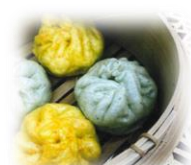
駒場学園高等学校 「ぎょ！ぎょ！魚肉まん」