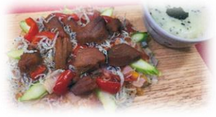
静岡県立焼津水産高等学校 「美味★SEAピザ」