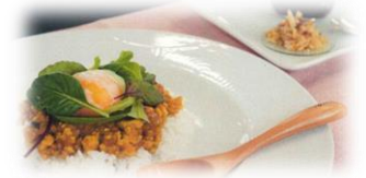
愛媛県立宇和島水産高等学校 「タイスパキーマカレー」