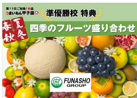
「四季フルーツ盛り合わせ」 チーム全員分