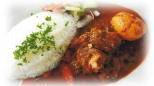
高知県立山田高等学校 「ごろっとシカカレー」