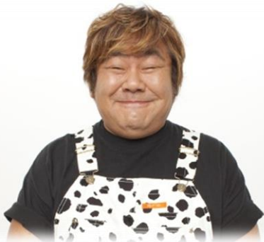
タレント 石塚 英彦様