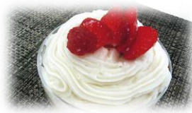
福岡県立福岡講倫館高等学校 「福岡デザートうどん！」