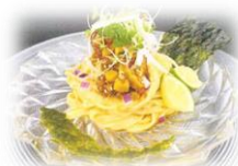
宮城県水産高等学校 「旨辛坦々風ホヤうどん」