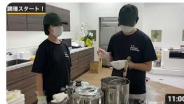
第11回ご当地！絶品うまいもん甲子園東海北陸エリア選抜大会 386 回視聴・4 か月前