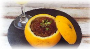
山口県立山口農業高等学校西市 分校「すきっちゃ山口坦々麺」