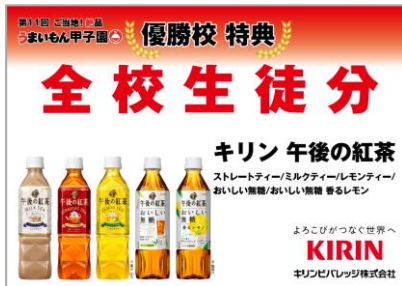
キリン午後の紅茶 (ストレートティー/ミルクティー/レモン ティー/おいしい無糖/ おいしい無糖 香るレモン) 全校生徒分