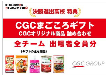
CGCまごころギフト 詰め合わせ チーム全員分