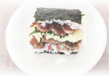
北海道帯広南商業高等学校 「わやうめえ蝦夷にぎ2」