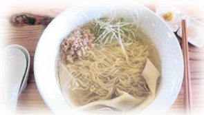
石川県立翠星高等学校 「丸ごとSDGs 雲呑麺」