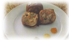
宮崎県立小林秀峰高等学校 「葉七美咲霧島おむすび」